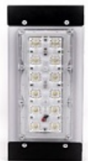
SVTR-STR-PSL- 27W-100 Мощность, Вт : 27 Световой поток, лм :3510